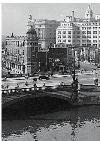
昭和初期の日本橋風景